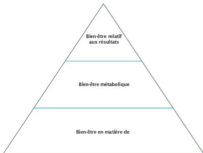
Graphique 2 : Tripode des besoins des diabétiques et des thérapies

consulter une travailleuse sociale ou un travailleur social et savoir que la mention du dialogue avec le patient au sujet de la hiérarchie de ses besoins et des déterminants sociaux de la santé serait une excellente façon d'aborder les questions qu'il faut résoudre.