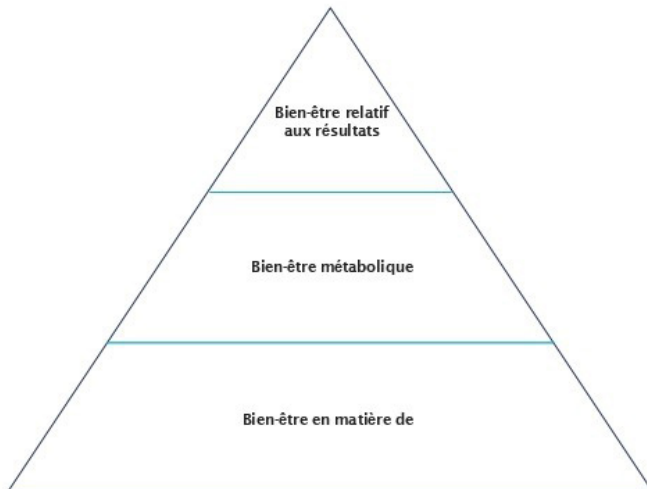
Graphique 2 : Tripode des besoins des diabétiques et des thérapies

consulter une travailleuse sociale ou un travailleur social et savoir que la mention du dialogue avec le patient au sujet de la hiérarchie de ses besoins et des déterminants sociaux de la santé serait une excellente façon d'aborder les questions qu'il faut résoudre.